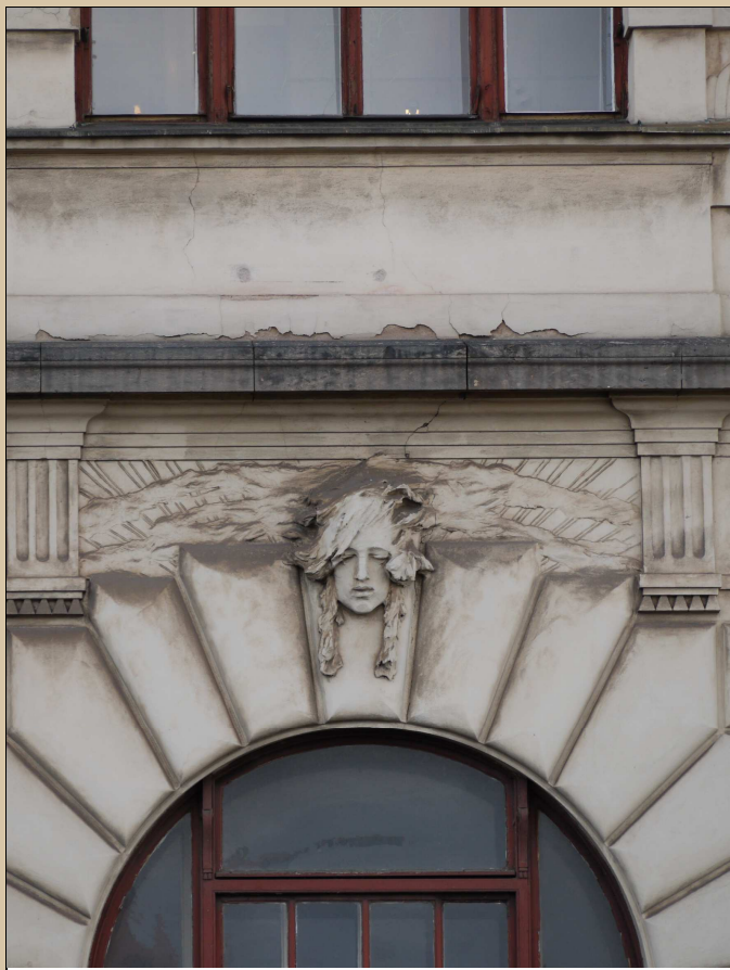
Stav v roce 2017